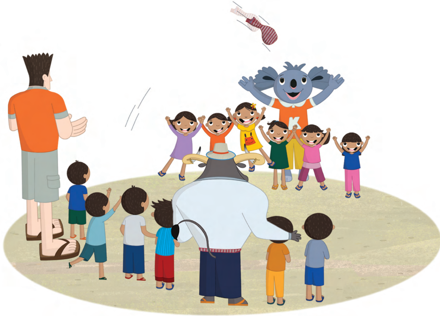
ដំបូង ញកកាត់លេងស្លៀងចោលល្មួង