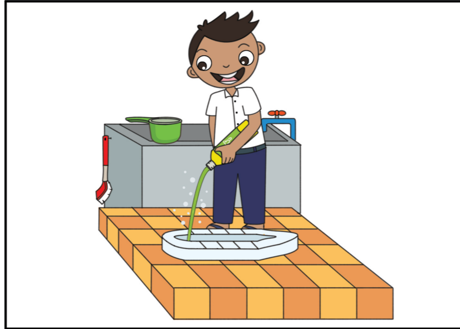
២. ចាក់សាប៊ូចូលក្នុងបង្គន់