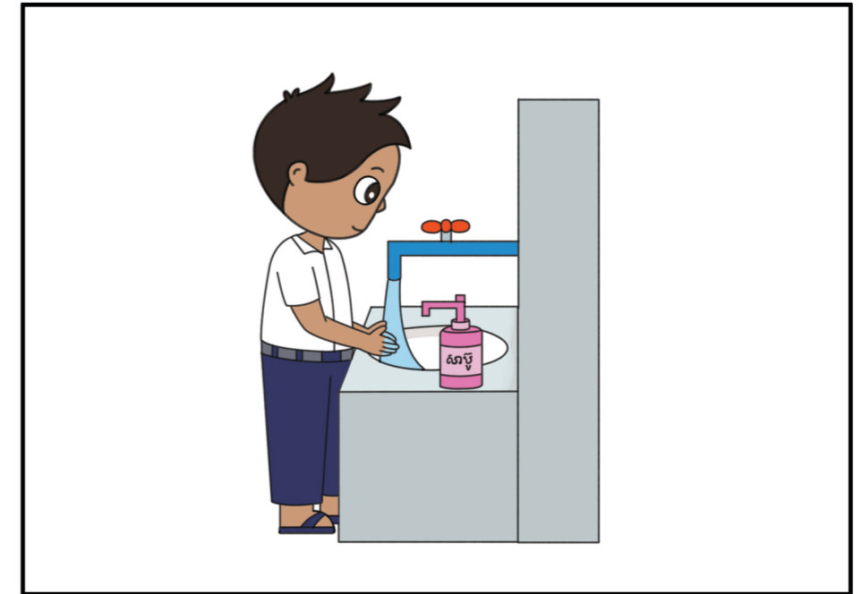
៦. លាងសម្អាតដៃឱ្យបានស្អាត