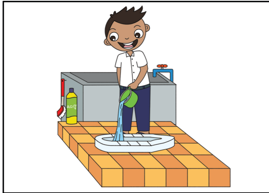
៥. ចាក់ទឹកចូលក្នុងបង្គន់