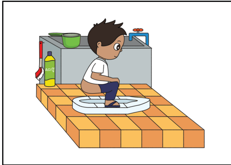
៤. អង្គុយចុះ